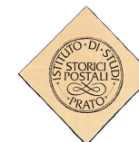
Istituto di studi storici postali Prato