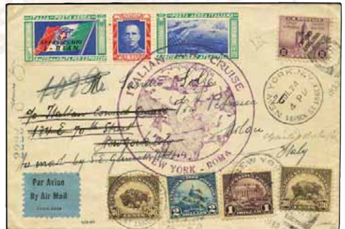
Lotto n.132 base € 5.000,00 realizzo € 15.000,00