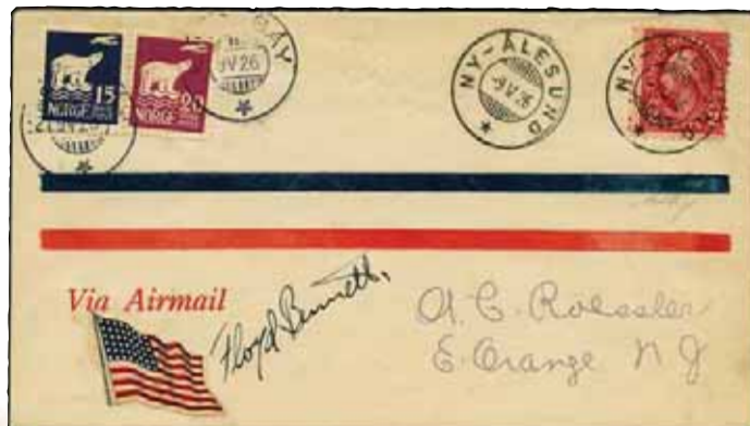
Lotto n.21 base € 2.000,00 realizzo € 3.600,00