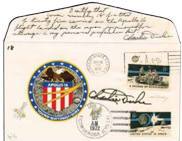
Lotto n.151 base € 42.000,00 realizzo € 55.000,00

Numero lotti in asta: 182 Numero lotti venduti: 154 Percentuale lotti venduti: 85% Incremento percentuale medio sul prezzo base: 47% Durata dell'asta: 70 minuti