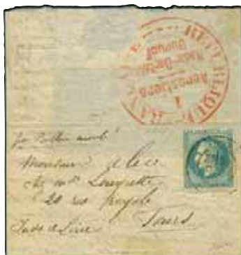
Lotto n.2 base € 3.000,00 realizzo € 4.700,00